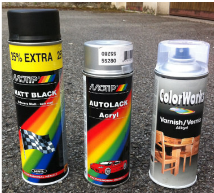
IMG_2427.JPG (76.77 Kio) Vu 23 fois