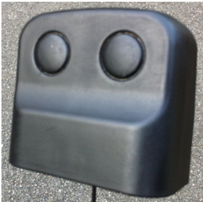
IMG_2430.JPG (39.88 Kio) Vu 23 fois

C'est bien, seulement au toucher (une fois sec bien sûr), on ressent des p'tits défauts, de là, il faut reponcer très légèrement au grain 600 :