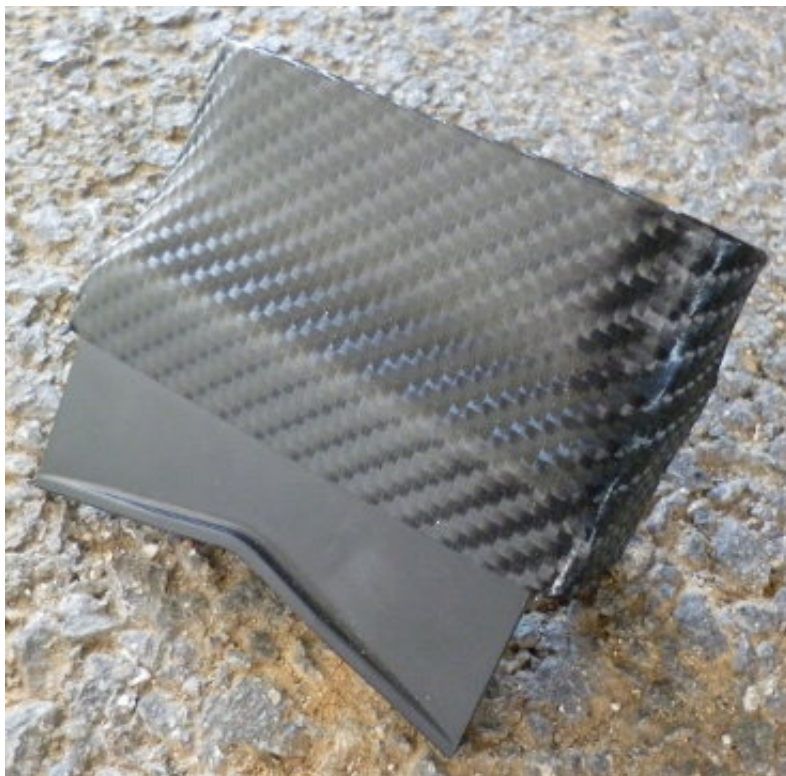
P1020370.JPG (62.13 Kio) Vu 23 fois

Maintenant que le travail de peinture est fini, on peut remonter le tout !