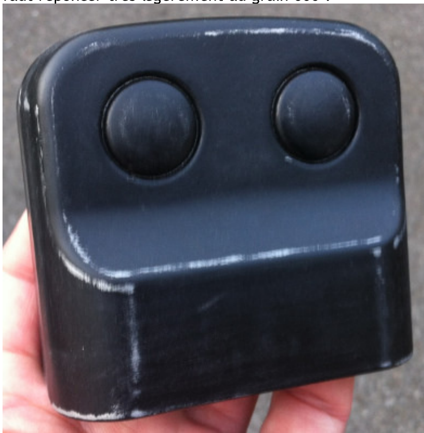
IMG_2432.JPG (42.16 Kio) Vu 23 fois

C'est bien, seulement au toucher (une fois sec bien sûr), on ressent des p'tits défauts, de là, il faut reponcer très légèrement au grain 600 :